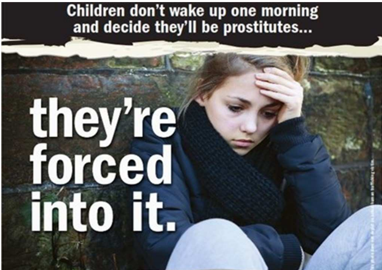
Children trapped into serious crimes

ചുഷകരെ പൂർണ്ണമായും ആശ്രയിക്കത്തക്ക വിധത്തിലുള്ള മനുഷ്യാസ്ത്രപരവും ബുദ്ധിപൂർവ്വകവുമായ കൃത്യങ്ങൾ ഒളിപ്പിച്ചിട്ടുള്ളവയാണ് മനുഷ്യക്കടത്തിന്റെ ആഗോളശൃംഖല. ഇരയാക്കപ്പെടുന്ന വ്യക്തികൾക്കും അവരുടെ സ്വന്തക്കാർക്കും എതിരായ ഭീഷണി, അവരുടെ മേൽ ചുമത്തുന്ന സമ്മർദ്ദം എന്നിവയ്ക്കു പുറമെ, തിരിച്ചറിയൽ രേഖകളുടെ കവർന്നെടുക്കൽ, ശാരീരിക പീഡനം എന്നിവയും മനുഷ്യക്കടത്തുമായി ബന്ധപ്പെട്ടതും ഇന്ന് ഈ മേഖലയിൽ നിലനില്ക്കുന്നതുമായ അതിക്രമങ്ങളാണ്. ഇരകളായവർക്കുള്ള പൊതുവായ സഹായം, അവരുടെ മാനിസകവും വിദ്യാഭ്യാസപരവുമായ പുനഃരധിവാസം, അവർ ആയിരുന്നതും അവർക്ക് നഷ്ടമായതുമായ സാമൂഹ്യചുറ്റുപാടിലേയ്ക്കുള്ള തിരിച്ചുവരവ് എന്നിങ്ങനെ മനുഷ്യക്കടത്തിന്റെ മൂന്നു തലങ്ങളിലാണ് അധികവും സന്ന്യസ്തർ പ്രവർത്തിക്കുന്നത്.