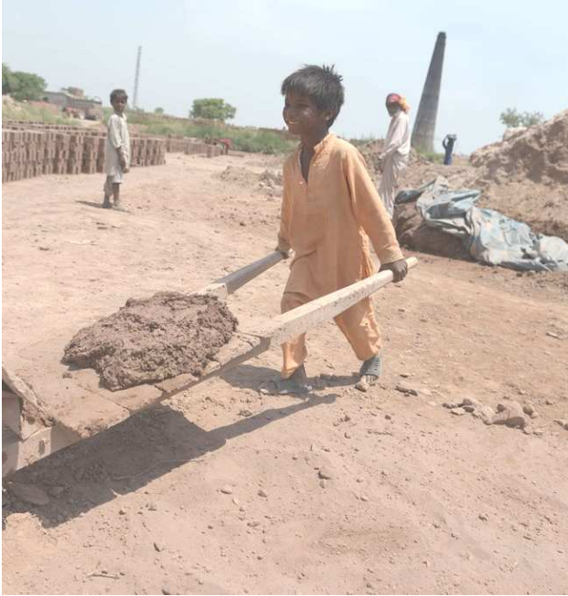
The oppression of children continues

നീതിയിലും സ്നേഹത്തിലും പ്രചോദിതനായി പരസ്പര ബന്ധങ്ങളിൽ സായുജ്യം കണ്ട്‌ത്തന്ന ബുദ്ധിജീവിയാണ് മനുഷ്യൻ. അതിനാൽ അന്തസ്സും, സ്വാതന്ത്ര്യവും, സുതാര്യതയും മാനവപുരോഗതിക്ക് അനിവാര്യമാണ്. എന്നാൽ മനുഷ്യൻ മനുഷ്യനെ ചൂഷണംചെയ്യുന്ന ഇന്നിന്റെ വർദ്ധിച്ചുവരുന്ന വലിയ വിപത്ത്, നീതിയിലും സ്നേഹത്തിലും അധിഷ്ഠിതമായ വ്യക്തിബന്ധവും സാമൂഹിക ഐക്യവും വളർത്തുവാനുള്ള മനുഷ്യന്റെ അടിസ്ഥാന ദൗത്യത്തെ ദയനീയമായി തകർക്കുന്നുണ്ട്. മറ്റുള്ളവരുടെ മൗലികമായ അവകാശങ്ങളോടുള്ള അവജ്ഞയും, അവരുടെ സ്വാതന്ത്ര്യവും അന്തസ്സും അടിച്ചമർത്തുവാനുള്ള പ്രവണതയും ഇന്ന് ലോകത്ത് വിവിധ രൂപങ്ങൾ കൈവരിക്കുന്നുണ്ട്. ഇക്കാര്യങ്ങളെക്കുറിച്ച് എല്ലാവരോടും പങ്കുവയ്ക്കണമെന്നും, അതുവഴി ദൈവവചനത്തിന്റെ വെളിച്ചത്തിൽ എല്ലാ സ്ത്രീ പുരുഷന്മാരെയും ഇനിമുതൽ 'അടിമകളായിട്ടല്ല, സഹോദരങ്ങളായി' പരിഗണിക്കണമെന്നുമാണ് ചുരുക്കത്തിൽ ഞാൻ അഭ്യർത്ഥിക്കുന്നത്.