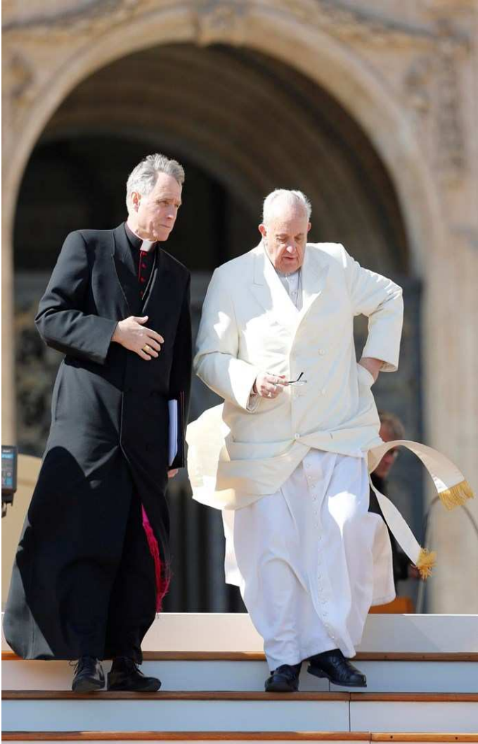
Pope Francis accompanied by Archbishop George Ganswein Prefect of the Pontifical House

തിന്മയുടെ പ്രതിഭാസത്തെ ചെറുക്കുവാൻ ഉതകുന്ന ആനുപാതികമായ ധാർമ്മിക പ്രേരകശക്തി നമുക്കിന്ന് ആവശ്യമാണ്. അതിനാൽ നവമായ മാനുഷിക അടിമത്വത്തിന്റെ കറുത്തമുഖം കണ്ട്‌ിട്ടുള്ള സന്മനസ്സുള്ള സകലരോടും, ഉന്നതതല സാമൂഹ്യസ്ഥാപനങ്ങളോടും ഈ തിന്മയുടെ കൂട്ടാളികളാകരുതെന്നും, അതിന് കീഴ്പ്പെട്ട തങ്ങളുടെ അന്തസ്സും സ്വാതന്ത്ര്യവും നഷ്ടപ്പെട്ട സഹോദരങ്ങളുടെ യാതനകളിൽനിന്നും ഒഴിഞ്ഞുമാറരുതെന്നും അഭ്യർത്ഥിക്കുന്നു. ക്രിസ്തു തന്റെ മുഖം വെളിപ്പെടുത്തുന്ന ഈ എളിയവരുടെ വിമോചനത്തിനായി നാം ചെയ്യുന്നതെല്ലാം അവിടുത്തെ മൗതിക ദേഹത്തിന്റെ മുറിപ്പാടുകൾ സൗഖ്യപ്പെടുത്തുകതന്നെ ചെയ്യും (മത്തായി 25, 40-45).