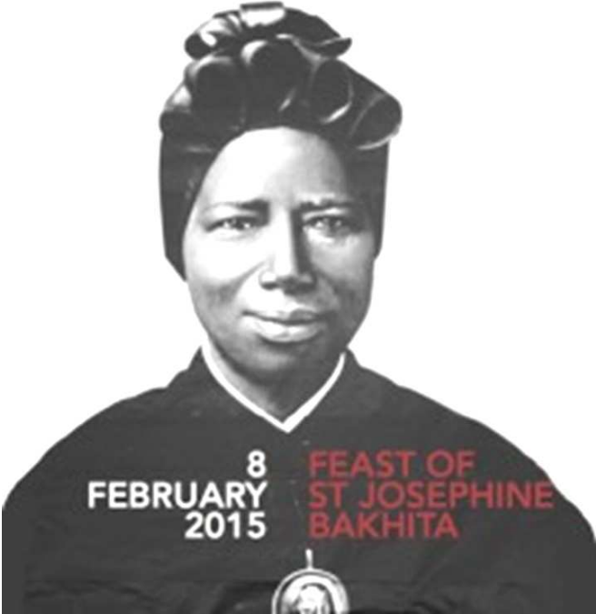
Slave become Saint – St. Josephine Bakhita

ആഫ്രിക്കൻ രാജ്യമായ സുഡാനിൽ അടിമക്കച്ചവടക്കാർ തട്ടിക്കൊണ്ടു പോവുകയും, പിന്നെയും വേറെ മുതലാളിമാർക്ക് മറിച്ച് വിലക്കുകയും, ക്രൂരമായ പീഡനങ്ങൾക്ക് വിധേയയാക്കപ്പെടുകയും ചെയ്ത ജോസഫിൻ ബക്കിത്ത എന്ന യുവതി പിന്നീട് വിശുദ്ധയായത് ചരിത്രമാണ്.