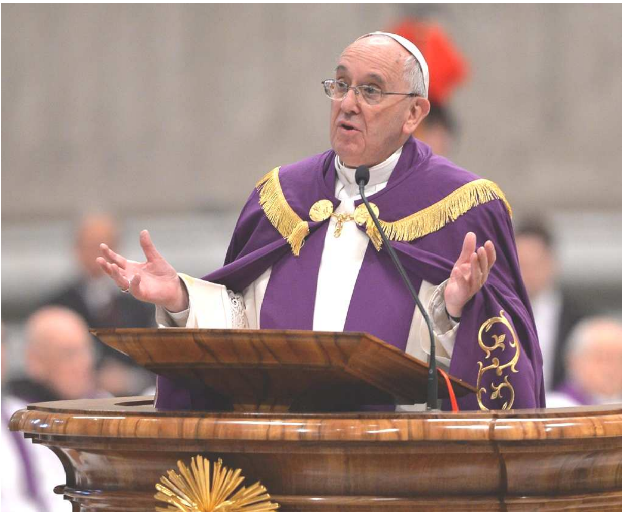
The declaration of the Extraordinary Holy Year in St. Peter's Basilica on 13 March 2015

2015 ഡിസംബർ 8-ാം തീയതി ദൈവമാതാവിന്റെ അമലോത്ഭവത്തിരുനാൾ മുതൽ 2016 നവംബർ 20-ന് ദൈവിക കാരുണ്യത്തിന്റെ സജീവ ദർശനമായ ക്രിസ്തുരാജന്റെ തിരുനാൾവരെയായി വിശുദ്ധവത്സരം