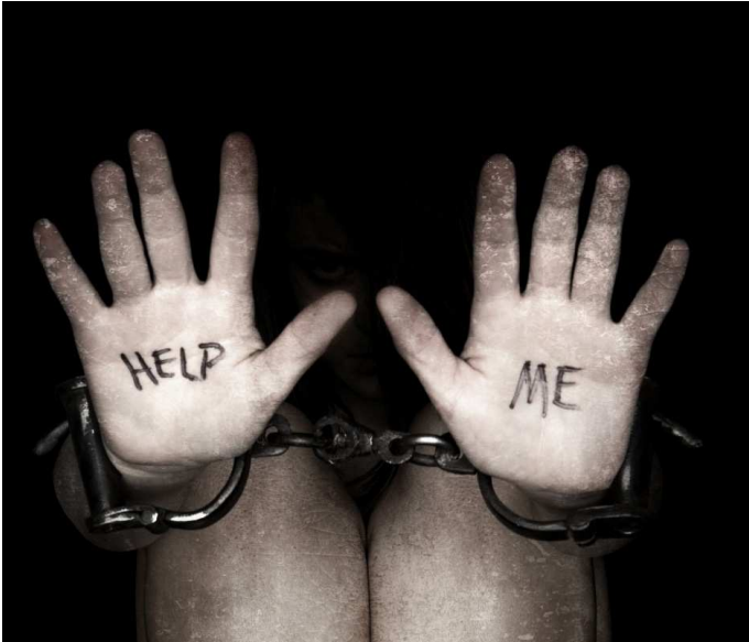
Global fraternity can fight global slavery

അനുദിന ജീവൽപ്രശ്നങ്ങളുടെ വ്യഥയിൽ വളരുന്ന സാമൂഹ്യചുറ്റുപാടിലെ നിസംഗ ഭാവംമൂലം തിന്മകൾ കണ്ട്‌ില്ലെന്നു നടിക്കുകയാണ് ചിലർക്ക് എളുപ്പം. എന്നാൽ മറ്റുചിലർക്ക് സാമൂഹ്യ സംഘടനകളിൽ പ്രവർത്തിച്ചുകൊണ്ട് വേദിനിക്കുന്നവരോട് അനുഭാവം പ്രകടിപ്പിക്കുവാനും, സാധിക്കുന്ന വിധത്തിൽ അവരെ വാക്കുകൊണ്ടോ പ്രവൃത്തികൊണ്ടോ തുണയ്ക്കുവാനും സാധിക്കുന്നുണ്ട്. ഇതുവഴി നമുക്കൊന്നും നഷ്ടപ്പെടുന്നില്ലെങ്കിലും, ലക്ഷ്യബോധം നഷ്ടപ്പെട്ട വ്യക്തികളുടെ ജീവിതത്തിൽ മാറ്റങ്ങൾ സൃഷ്ടിക്കുവാനും, പ്രത്യാശയുടെ പാത തുറക്കുവാനും ഇടയാകും. ഒപ്പം അത് നമ്മുടെ ജീവിതത്തെ ക്രിയാത്മകമായി സ്പർശിക്കുകയും ചെയ്യും.