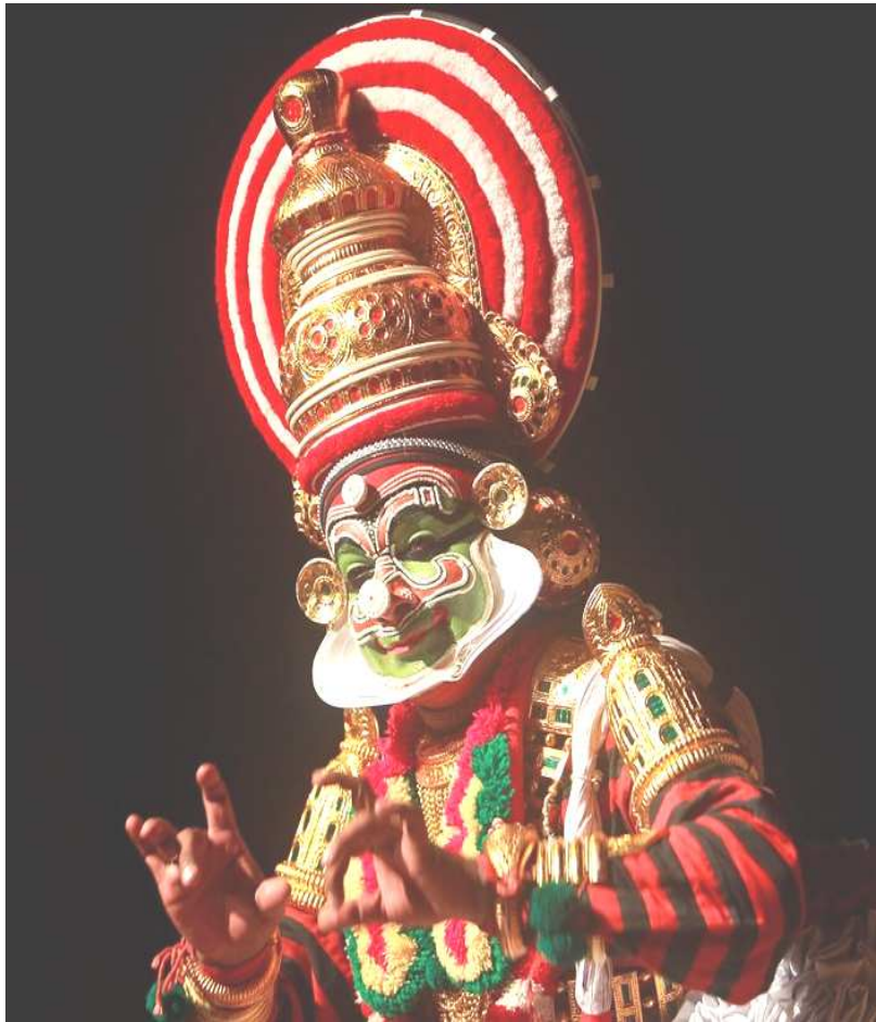
Modern slavery thrives also under the mask of tourism

മനുഷ്യക്കടത്തിൽ വ്യക്തി ഏൽക്കുന്ന ചൂഷണത്തിന്റെ മുറിവ് പൂർണ്ണമായും ഇല്ലാതാക്കുക ക്ലേശകരമാണ്. മനുഷ്യക്കടത്ത് നിരോധിക്കുക, ഇരകളായവരെ സംരക്ഷിക്കുക, അതിക്രമികളെ നിയമപരമായി ശിക്ഷിക്കുക - എന്നിങ്ങനെയുള്ള ത്രിവിധ സമർപ്പണം ഉത്തരവാദിത്തപ്പെട്ട സ്ഥാപനങ്ങളിൽനിന്നും ആവശ്യമാണ്. തല്പര കക്ഷികൾ വിരിക്കുന്ന മനുഷ്യക്കെണിയുടെ ആഗോള ശൃംഖല തകർക്കണമെങ്കിൽ രാജ്യാന്തര തലത്തിൽ സംരക്ഷണ വലയത്തിന്റെ തത്തുല്യമായ നീക്കങ്ങൾ അനിവാര്യമാണ്. ലോകത്ത് ഇന്നു നടക്കുന്ന ഉല്പന്നങ്ങളുടെ വൻവിപണനം, കയറ്റുമതി, ദത്തേടുക്കൽ, വിദേശ തൊഴിൽ സാധ്യതകൾ, വിനോദസഞ്ചാരം, കുടിയേറ്റം എന്നീ മേഖലകളിൽ മനുഷ്യാന്തസ്സ് മാനിക്കപ്പെടുന്നുണ്ട് എന്ന് നിയമനിർമ്മാണത്തിലൂടെ രാഷ്ട്രങ്ങൾ ഉറപ്പുവരുത്തേണ്ടതുണ്ട്. അടിസ്ഥാന മനുഷ്യാവകാശങ്ങൾ മാനിക്കപ്പെടുവാനും നിഷേധിക്കപ്പെട്ടവ വീണ്ടെടുക്കുവാനും നീതിനിഷ്ഠമായ നിയമസംവിധാനങ്ങൾ അനിവാര്യമാണ്.