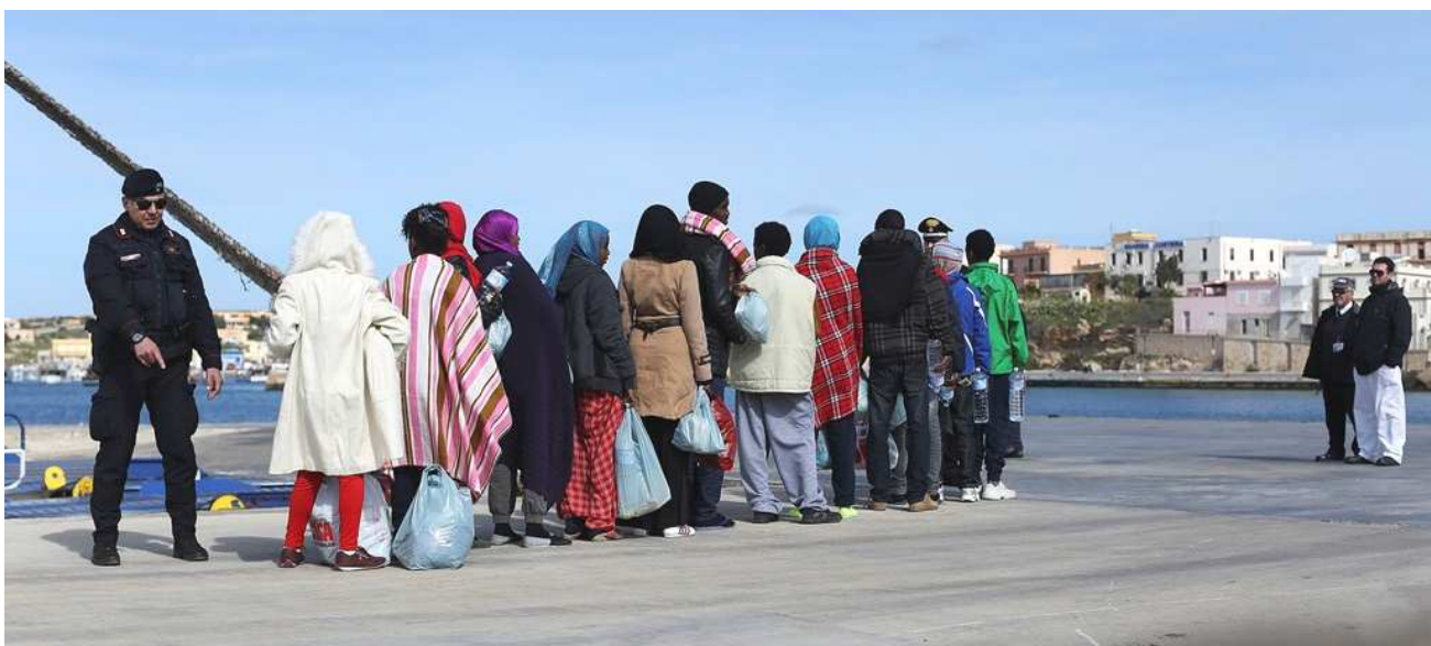
Migrants transferred from place to place by immigration departments

ചുഷകരെ പൂർണ്ണമായും ആശ്രയിക്കത്തക്ക വിധത്തിലുള്ള മനുഷ്യാസ്ത്രപരവും ബുദ്ധിപൂർവ്വകവുമായ കൃത്യങ്ങൾ ഒളിപ്പിച്ചിട്ടുള്ളവയാണ് മനുഷ്യക്കടത്തിന്റെ ആഗോളശൃംഖല. ഇരയാക്കപ്പെടുന്ന വ്യക്തികൾക്കും അവരുടെ സ്വന്തക്കാർക്കും എതിരായ ഭീഷണി, അവരുടെ മേൽ ചുമത്തുന്ന സമ്മർദ്ദം എന്നിവയ്ക്കു പുറമെ, തിരിച്ചറിയൽ രേഖകളുടെ കവർന്നെടുക്കൽ, ശാരീരിക പീഡനം എന്നിവയും മനുഷ്യക്കടത്തുമായി ബന്ധപ്പെട്ടതും ഇന്ന് ഈ മേഖലയിൽ നിലനില്ക്കുന്നതുമായ അതിക്രമങ്ങളാണ്. ഇരകളായവർക്കുള്ള പൊതുവായ സഹായം, അവരുടെ മാനിസകവും വിദ്യാഭ്യാസപരവുമായ പുനഃരധിവാസം, അവർ ആയിരുന്നതും അവർക്ക് നഷ്ടമായതുമായ സാമൂഹ്യചുറ്റുപാടിലേയ്ക്കുള്ള തിരിച്ചുവരവ് എന്നിങ്ങനെ മനുഷ്യക്കടത്തിന്റെ മൂന്നു തലങ്ങളിലാണ് അധികവും സന്ന്യസ്തർ പ്രവർത്തിക്കുന്നത്.